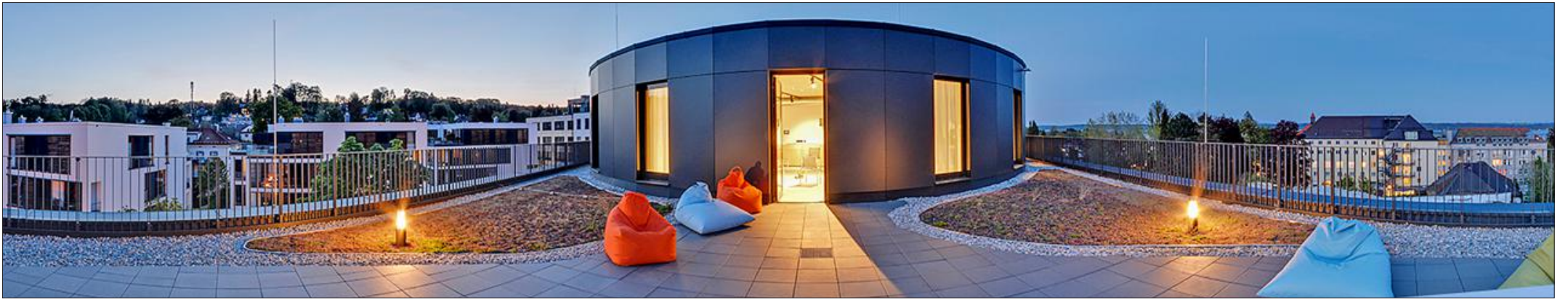
Die Dachterrasse der Akutklinik P3 zieht sich über das ganze Gebäude. Hier kann man mit Blick auf die Alpen und den Starnberger See zur Ruhe kommen.